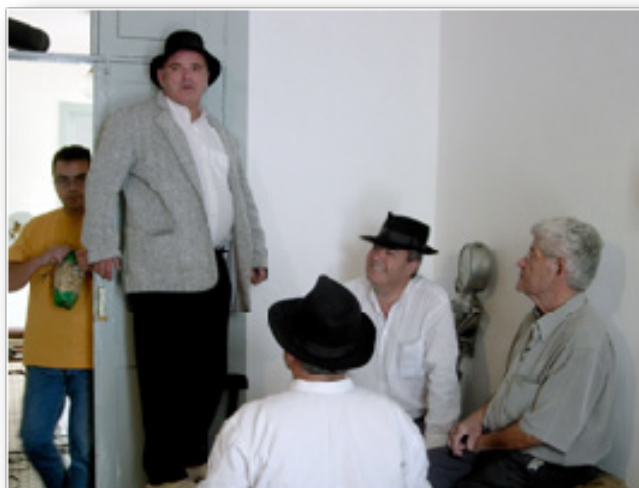
Momento de la grabación de uno de los cuentos

Una vez vista esta Segunda Parte, en el tiempo que nos quede es conveniente comentar oralmente cuál es la impresión que se les queda después de haber estado trabajando durante varias jornadas el espectáculo Monagas somos Todos : si se sienten ahora algo más identificados después de tener conciencia de asuntos hasta ese momento quizás nunca pensados, si entienden más lo que se expresa en los golpes humorísticos, etc.