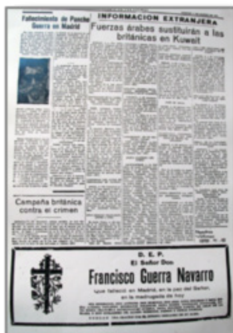
La prensa anuncia la muerte de Pancho Guerra (Recorte presente en la exposición llevada a cabo en el centenario del autor)

y expresiones canarias que la literatura de Guerra presenta hará cuestionarse al alumnado la historicidad y la variabilidad de la lengua según el momento histórico en el que se habla, en tanto que muchos aspectos de esa forma de hablar ya no se utilizan o, en todo caso, perviven actualmente en unos hablantes concretos con unas determinadas características.