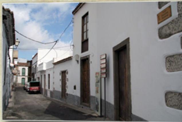
Calle donde vivió el autor en Tunte. Hoy lleva su nombre

Reside primero en la calle López Botas del barrio de Vegueta, con una habitación en la azotea en donde solía tocar y cantar gratamente acompañado de su timple o su guitarra. Años más tarde la familia viviría un nuevo traslado al barrio de Triana, a una casa de la calle San Bernardo.