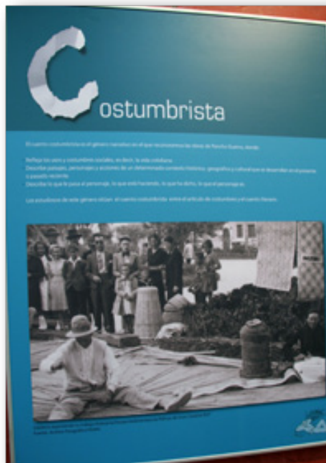
Panel de la exposición El legado de Pancho Guerra

. Otra curiosa expresión llamativa es aquella que se dice cuando le contestaron, tras preguntar él, con un sí esmaya(d)o o desmaya(d)o . ¿Qué querrá decir esto? ¿Es una atribución normal la que se le está dando a una respuesta afirmativa ( sí ) a partir del término desmayado ? Utiliza un diccionario de canarismos, si fuera preciso, para responder.