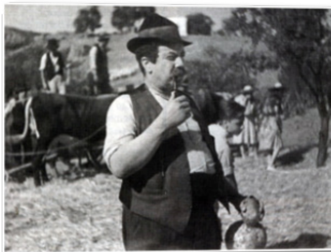
Pepe Castellano, conocido actor vinculado estrechamente al personaje Pepe Monagas

Pensar que la tendencia artística llamada Regionalismo , o Costumbrismo , es la única y mejor manera de transmitir la identidad de un pueblo es tan desenfocado como expresar que tal corriente responde a un tipo de literatura insignificante.