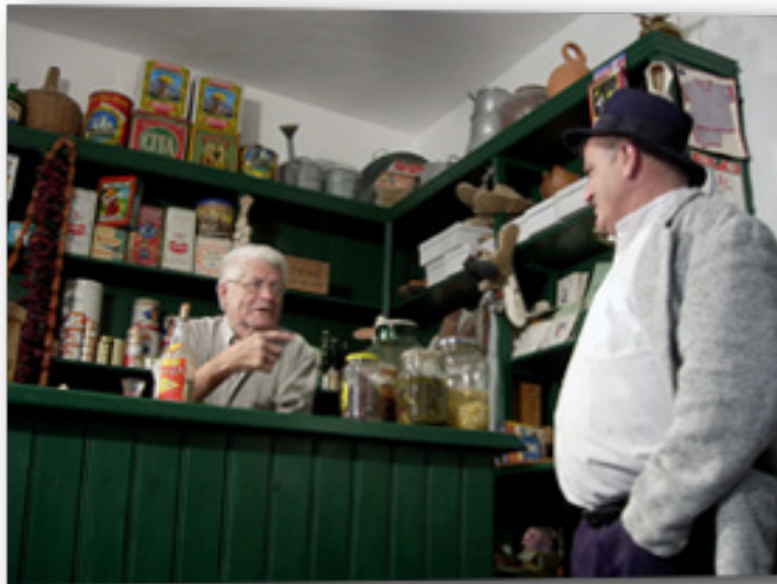
Grabación en el Museo Vivo de la tienda del Proyecto de Desarrollo Comunitario