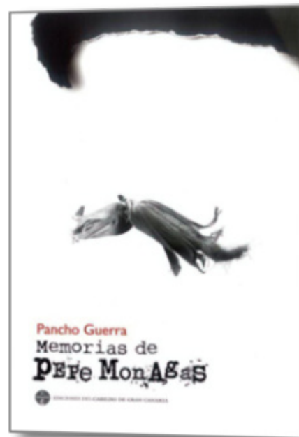
Primer tomo de las nuevas Obras Completas

La obra de Pancho Guerra camina por Gran Canaria, más que por ningún otro sitio; concretamente, por Las Palmas de Gran Canaria. Pero su estela se extiende, especialmente a partir de infinidad de términos y locuciones -y través de los comportamientos que acompañan esa manera de expresarse-, por todas las islas de Canarias. Consecuentemente con lo que decía, coherentemente a lo que planteaba, la obra de Pancho Guerra irradia desde la isla en que nació y desde la que referenció literariamente en mayor grado, pero su amplio espectro significativo aún, en buena medida, todas las Canarias.