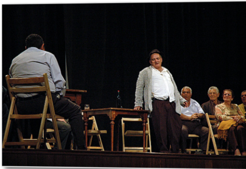
Momento de la representación en La Aldea de Monagas somos Todos

Es nuestro deseo que esta nueva obra sea de utilidad para el profesorado canario y que contribuya, al menos en parte, a una más justa y adecuada valoración de las formas expresivas de nuestra modalidad lingüística y de nuestras obras literarias, a la vez que ponga su granito de arena en la comprensión de los complejos y ricos matices de la lengua que hablamos desde la perspectiva canaria.