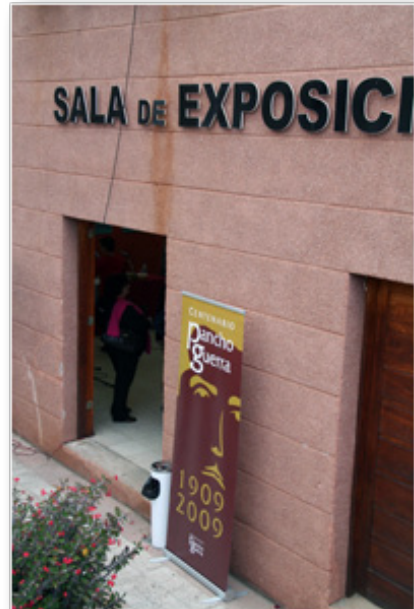
Entrada a la exposición en Valsequillo

Han corregido sus quehaceres, la casa de ustedes no era digna, les voy a contar un fenómeno, ¿habrán roto la botella?, los escuché y se la acerqué.