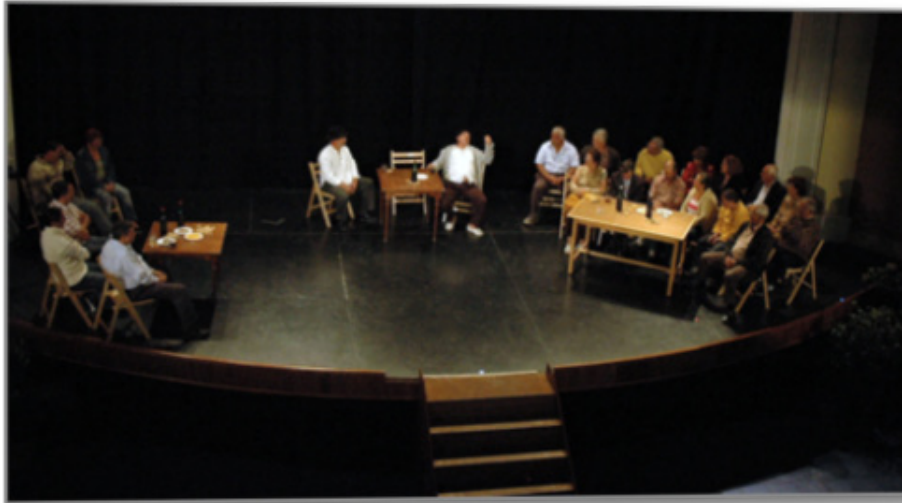
Plano general de la representación en La Aldea de San Nicolás

Nuestro trabajo sobre la obra de Pancho Guerra se apega de lleno a los Contenidos Canarios, concretamente -como hemos dicho- al área de Lengua y Literatura, siempre en relación con otras disciplinas de nuestro sistema de enseñanza. A pesar de que las leyes educativas manifiestan desde hace ya unos cuantos años la obligatoriedad de la impartición de estos Contenidos, la realidad de los Centros constata que, por diferentes motivos, la enseñanza de estos conocimientos sobre el patrimonio de nuestra cultura se reduce, en muchos casos todavía, a la celebración anual del Día de Canarias . Evidentemente, la panorámica deseable sería aquella donde la enseñanza de nuestra idiosincrasia como pueblo tuviera, al menos, el suficiente tiempo que se supone debe tener en cada una de las materias según los porcentajes establecidos para ello. Nos parece asombrosa por negativa, en esta línea argumental que seguimos, la supresión del Programa de Contenidos Canarios que la Consejería de Educación tenía en marcha hasta hace unos dos años.