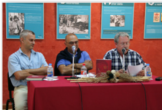
Una de las presentaciones del libro de los cuentos de Monagas en décimas

. ¿Se confirma en estos ejemplos suyos la utilización que decíamos de tipo afectivo, en ocasiones con respeto, de dicho diminutivo?