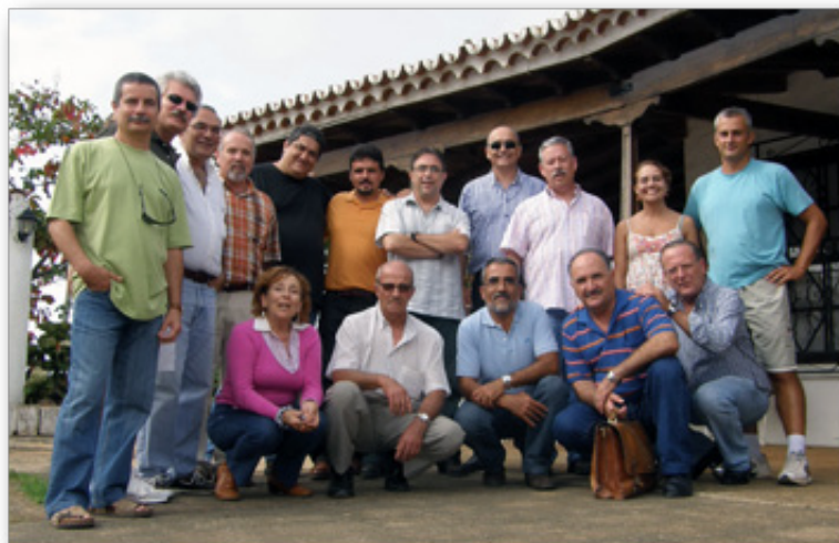
Participantes en el libro Los Cuentos Famosos de Pepe Monagas en Décimas