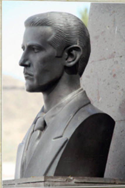
Perfil del busto del autor en San Bartolomé de Tirajana

Allí fallecería en 1961, con 52 años, de un infarto durante una sesión de cine. Poco después, en el mencionado Hogar Canario de Madrid, sus amigos fundaron la Peña Pancho Guerra, que se propuso la publicación de toda la obra, inédita o dispersa, del amigo desaparecido.