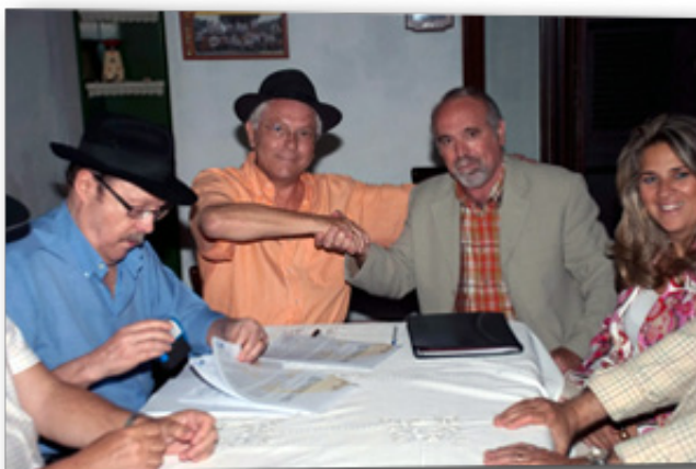
Firma de convenio entre la Fundación Canaria Pancho Guerra y la Orden del Cachorro Canario