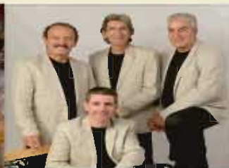
Grupo Musical Los Concejales de las Verbenas

Consigue tus entradas en los Colectivos Vecinales y Deportivos del Municipio.