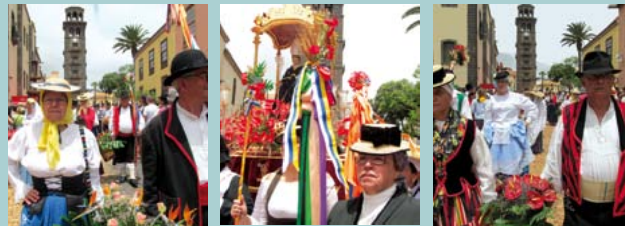
Pie de foto: Al igual que los romeros de las fotos, ayúdanos a conservar nuestra Romería